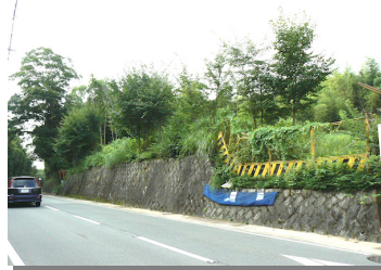
4丁目バス停から南を望む現場

高台地区周辺で大規模宅地開発計画が進められています。場所は高台4丁目4号公園の南一帯で、現在竹藪が少し切られています。計画では長岡京市と大山崎町にまたがる約1万坪の土地に150戸の住宅を建設する予定です。