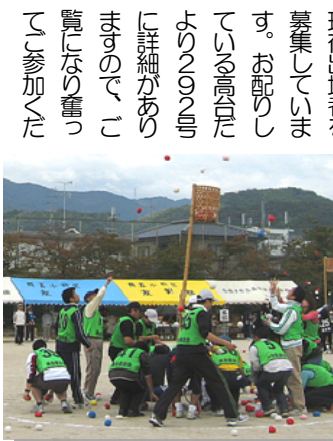
昨年の運動会での紅白玉入れ

長岡京市の「市民大運動会」は、10月3日(日)の時から長岡第五小学校校庭で行われます(予備日10日(日))。市民運動会には高台でチームを組んで毎日出場しています。種目は混合リレー・玉入れ・リレーボール・グルメ競走などです。