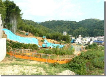
西代トンネル掘削予定地

先日JNCAの総会で「JNCA」(京都府「外環状道路」)の工事についての「高台地区懇談会」が行われました。国交省・道路公団・京都府・長岡京市・工事業者の16人が説明に来られ、住民は10名が参加しました。