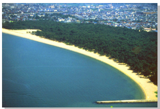
訪れる予定の 気比の松原

今回は1月23日(祝)にバス2台で定員の名で、小浜・敦賀方面に向かいます。日本海の荒々しい景観や豊潤な海の幸を楽しみたいと思います。多くの皆さんの参加で、近頃の遠近所への機会に「コミュニケーション」大いに盛り上がりたと思います。詳細は計画が固まると次第お知らせします。