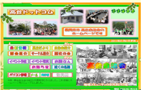
新HPのトップページ

高台自治会のホームページ(HP)を、2年前にアップし、これまで約1.2万件のアクセスがありました。そのHPを、自治会設立25周年を期にデザインを含め全面改訂し、またアドレスも変更し、 http://taka-dai.info となります。ブックマークいただければと思います。新しいHPには「自治会の紹介」「専門部会の活動」「サークルの紹介」「歴史の会の写真ビデオ」「イベントの写真集」「お隣さんの紹介」「近くの名所旧跡」「高台でHPをお持ちの方の紹介」「高台だよりのバックナンバー」「バス時刻表」などがあります(容量は1.3GB)。HPが更新された場合、既に登録されている70名の皆さんにはメールでお知らせしていますが、メール登録ご希望の方は、 n_takadai@yahoo.co.jp までお知らせください(登録はパソコンメールでも携帯メールでも構いません)