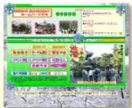
高台ホームページ(冬版)

高台自治会は創立25周年を迎え、記念行事・事業を行っています。その一環として「25周年記念誌」を制作しました。内容は自治会25年の歴史を振り返る対談、25年間の年表・数値データ、高台と周辺の懐かしの写真などで、モノクロ全16ページです。近々皆さんにお配りします。またカラー版を高台ホームページからもご覧いただけます。同時に「高台歴史を楽しむ会」も創立5周年を向え記念冊子を発行し、歴史の会会員の方には既にお配りしていますが、これも同ホームページからご覧いただけます。