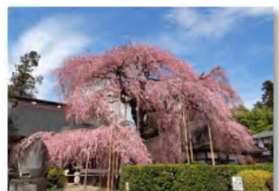
やがてこの枝垂れ桜のように...