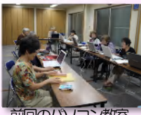
前回のパソコン教室