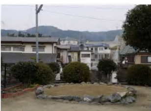
中央円形路分に植樹します

▼高台2丁目の東にある5号公園にあった蛍光灯電柱の移設と付近の整地を終えました。これは、高台自治会創立25周年記念として、ここに枝垂れ桜の記念植樹を行うためです。写真は有名な山梨慈雲寺の枝垂れ桜ですが、35周年のころにはきつこのように立派に育っているように思います。(公園東側斜面に記念植樹を移して下さるのをご希望ください)