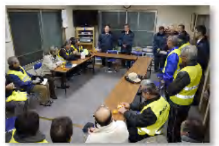
市から激励をいただきました

を打ちながら高台中を回り、火の用心と戸締り用心を訴えました。市議会議長と副市長、消防署の皆さんも激励に来られ挨拶をいただきました。参加された方からは「パトロール中家から出てくろうさんの一言が大いに励みとなりました」との感想をいただいています。