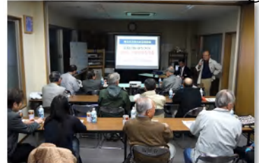
昨年の出前ミーティング

●11月12日(火)夜7時から、さくら会館で「災害に強いまち作り」をテーマに出前ミーティングが行われます。市の危機管理室の講師からお話しいたきます。たくさんお集まりください。