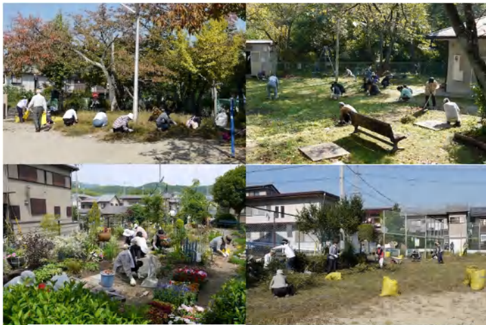
昨年秋の清掃風景：左上から時計回り、2号公園・3号公園・4号公園・5号公園(これのみ春)です