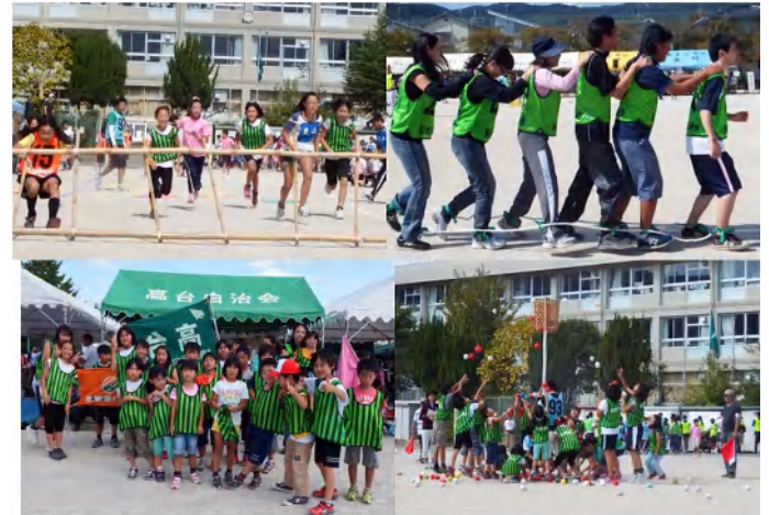
市民運動会での活躍：左上から時計回り、長岡五種・ムカデ競走・小学生玉入れ・競技参加児童の集合写真です