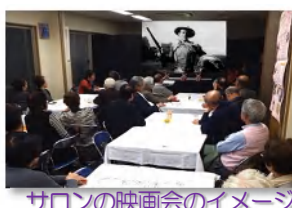
サロンの映画会のイメージ

④ ふれあいサロン ふれあいサロンとして、月1回程度、対象者などご来館の会館に会合いただき、懐かしい「映画鑑賞会」「カラオケ大会」「食事会」「茶話会」などを楽しんでいただきます。