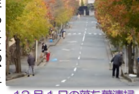
12月1日の落ち葉清掃

▶バス通りの街路樹の落ち葉清掃は、11月・12月の日曜と水曜日の計8日間、延べ240人の住民の皆さんの協力で終わりました。