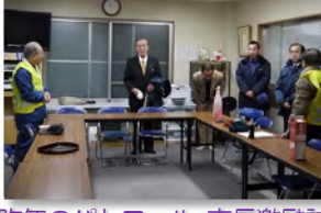
昨年のパトロール 市長激励訪問

▼「阪急西山天王山駅」が12月21日(土)に開業します。高台を通る阪急バスが減便になり時刻表が変わり、阪急電鉄京都線の時刻表が変更になり、高速バスこの乗り継ぎが可能になりますので、留意ください。