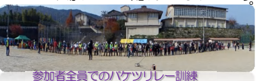
参加者全員でのバケツリレー訓練

そのあと3号公園に集結し、四中グラウンドに向かい、高台から直接会場に来られた方も含め、「ミニミニ主催の」防災フェスタに参加しました。