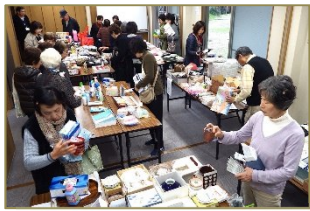
「人やまの黒だかり」のバザー

さくら祭り開催しました 「高台のふれあい」が4月5日(日)に開催されました。例年より早く満開になったさくら公園のメロイコンノは、散り急ぎ落花の絨毯を敷き始めていました。当日は3年続きのあいにくの天候でしたが、さくら会館で今年も巡ってきた春を楽しみました。