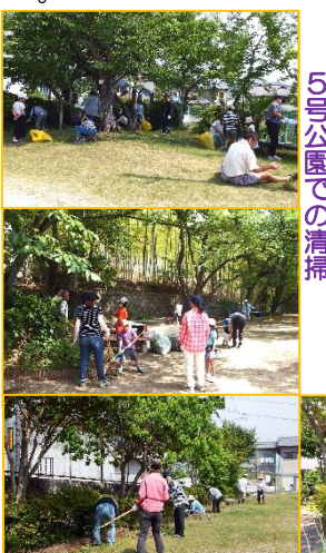
上から2号・3号・4号・5号公園での清掃

5月26日春の公園除草と、ごみゼロ運動を行いました。天気もよく6か所の公園で95名(2号公園・隣接する平井からの人を含む)2人3号公園と緑地・22人、4号グラウンド・28名、6号緑地を含む5号公園・23人の多くの皆さんの参加をいただき、ごみゼロ袋と黄色い袋合わせ151袋を出しました。