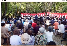
昨年の高台夏まつり

「高台夏まつり」は、高台自治会最大の恒例行事で、今年は8月17日(土)に開催されます。今年から自治会青年部が中心となって実施し、今準備が進んでいます。四中フラスバンドによる演奏、生ビール、かき氷、助六すし、フランクフルトなどの模擬店、盆踊り、さくら会館でのお地蔵さんなどがあります。福引券、敬老お楽しみ券、幼児・中学生券なども配布します。