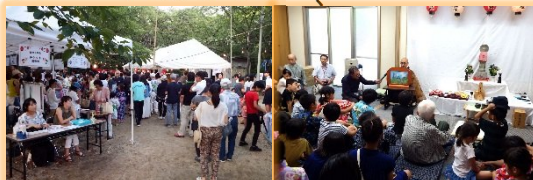
昨年の夏まつり、3号公園会場とさくら会館お地蔵さん

夏まつりでは、近隣の皆さんとより親睦を深めながら、中天にかかる立待月のもよおす夏のたまゆらの一時をお過ごしください。