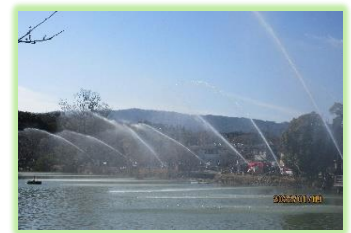
令和4年の放水訓練