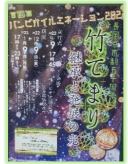
竹てまりのポスター